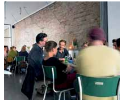
Das Wettbureau in der Prinzenallee 74 eröffnete vor einem Jahr. Es bietet Platz für kreative und gemeinnützige Projekte.